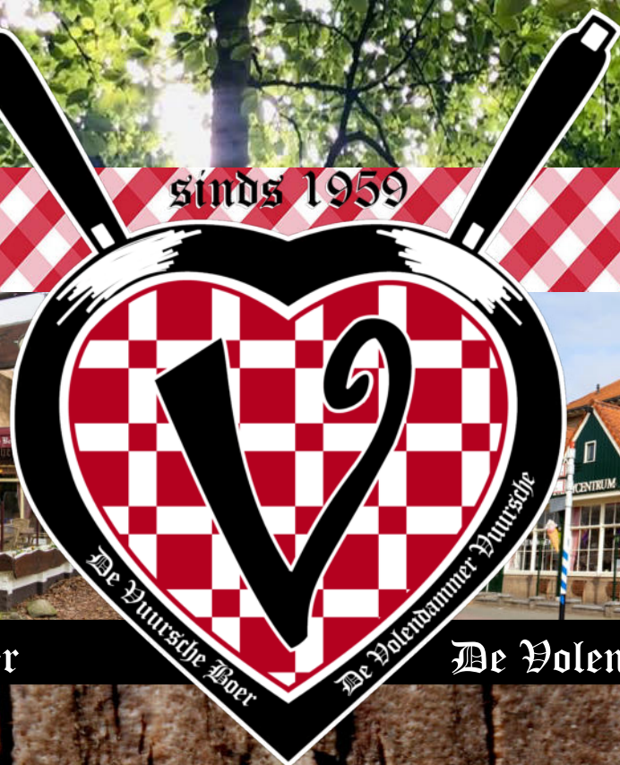
De Volendammer Vuursche