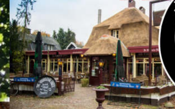
De Vuursche Boer