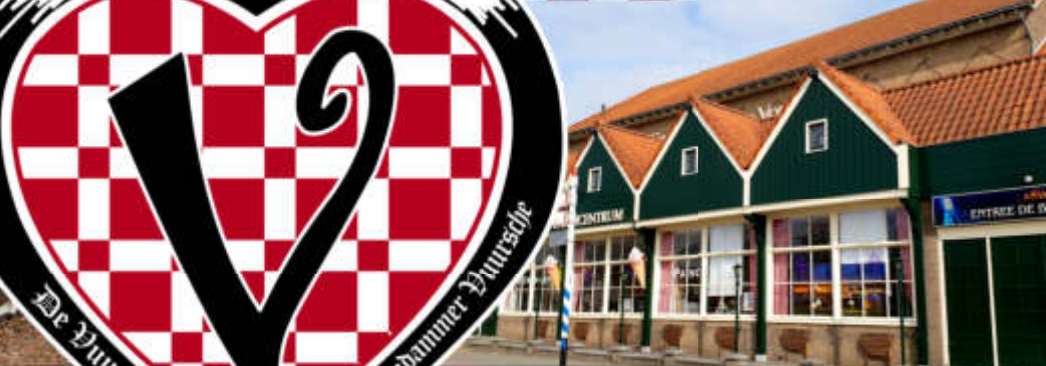
De Volendammer Vuursche